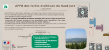
Un mémo plus précis de la réglementation