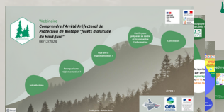
Le diaporama du webinar

Diverses informations sur l'association ainsi que sur les espèces et habitats qu'elle protège